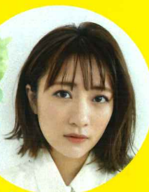
パーソナリティ 高橋みなみ